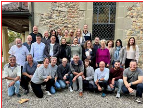
Toute l'équipe de la Revue 2022, lors du Ressayt en octobre