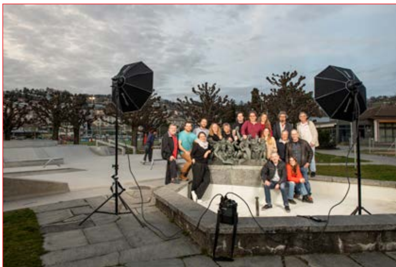
Une partie de l'équipe de 2023, lors des préparatifs