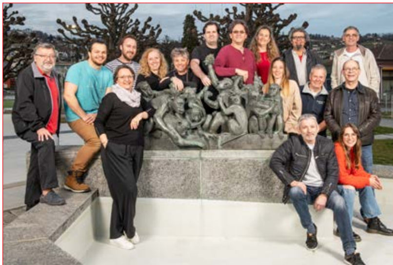
Les décorateurs et la troupe de la Revue 2023