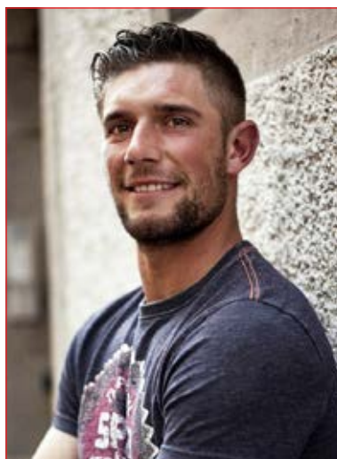
Paul Savoy Equipement et matériel