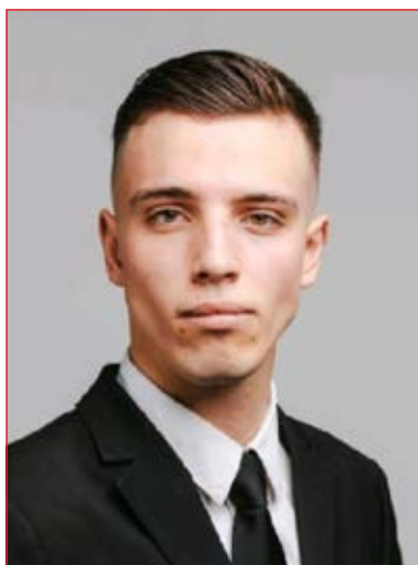
Vincent Aeby Equipement et matériel