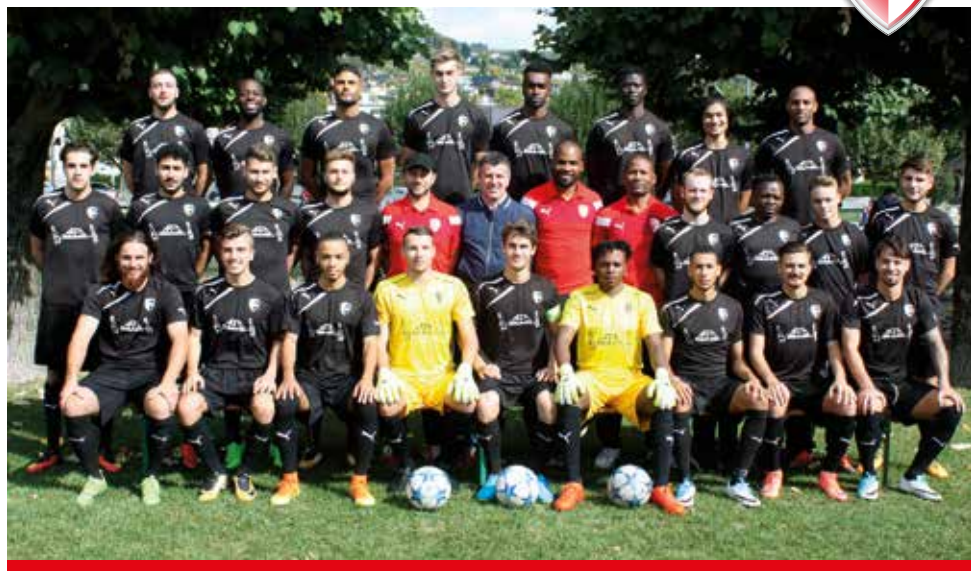
Photo FC Lutry A inter - 2017-2018