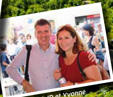
Le président JD et Yvonne