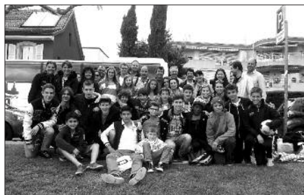
Photo du groupe ayant voyagé au Lac de Garde.