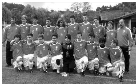
C1 finale de Coupe Vaudoise.