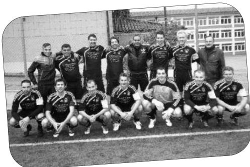
Match au sommet Lutry-Malley: Puce remet les crampons, Chappi, Flückiger, N'Lep, Isabella, que du beau monde.