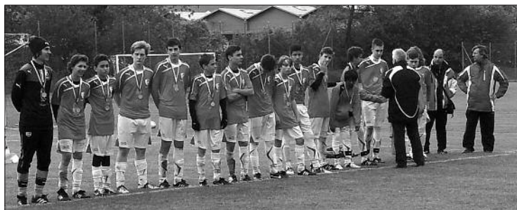
Remise des médailles de la finale de Coupe Vaudoise.